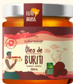
Óleo de Buriti Vidro 200 ml