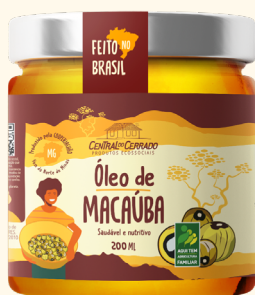
Óleo de Macaúba Vidro 200 ml