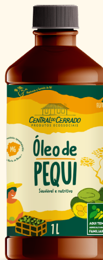
Óleo de Pequi PET 1L