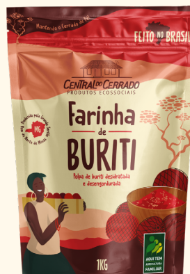
Farinha de Buriti 1kg