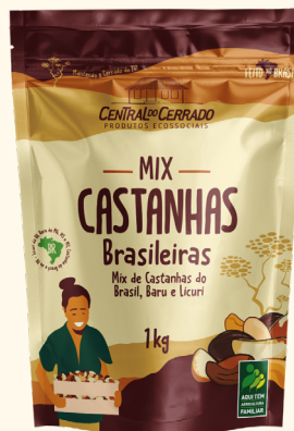
Mix de Castanhas 1kg