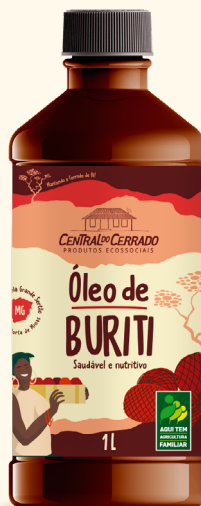
Óleo de Buriti PET 1L