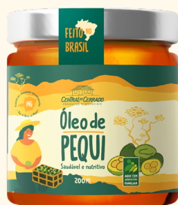
Óleo de Pequi Vidro 200 ml