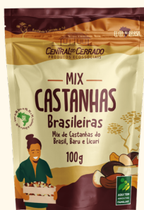
Mix de Castanhas 100g