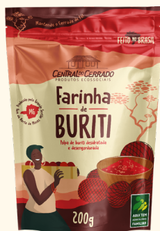
Farinha de Buriti 200g