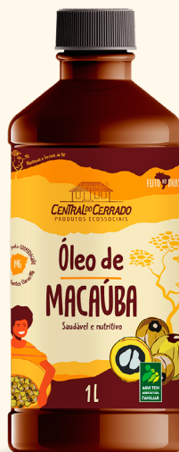
Óleo de Macaúba PET 1L