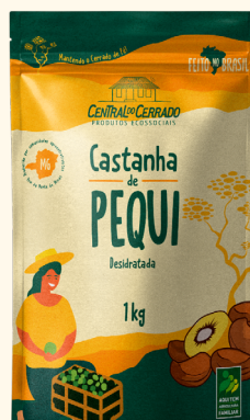
Castanha de Pequi 1kg