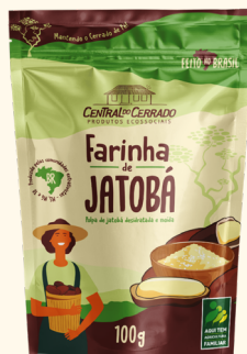
Farinha de Jatobá 100g