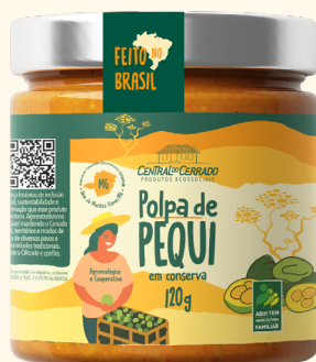
Polpa de Pequi Vidro 120g