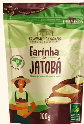
Farinha de Jatobá 500g