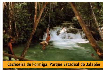
Cachoeira do Formiga, Parque Estadual do Jalapão