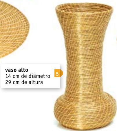
vaso alto 14 cm de diâmetro 29 cm de altura