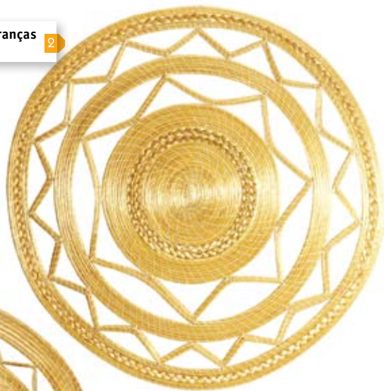
mandala vazada com tranças 51 cm de diâmetro