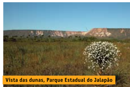
Vista das dunas, Parque Estadual do Jalapão