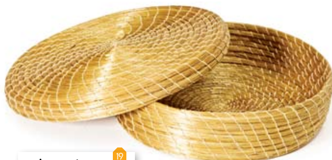
caixa com tampa 19 21 cm de diâmetro 5,5 cm de altura