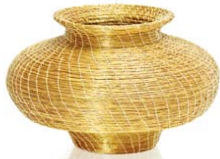
pote aladim 16 9 cm de diâmetro 12 cm de altura