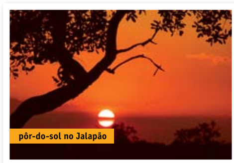
pôr-do-sol no Jalapão