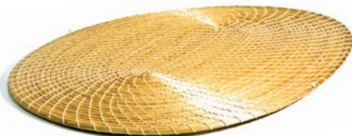
suplá oval 17 30 x 40 cm