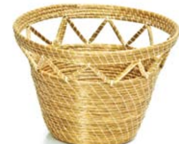
cesta vazada 21 cm de diâmetro 13 cm de altura