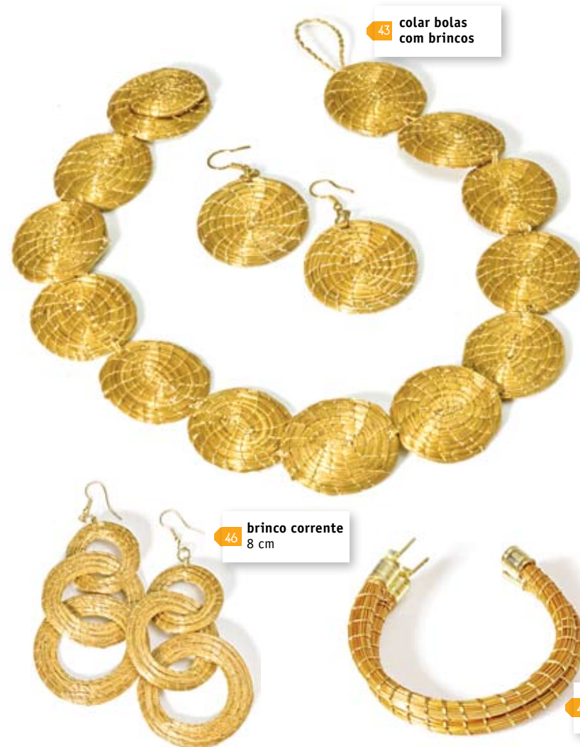
43 colar bolas com brincos