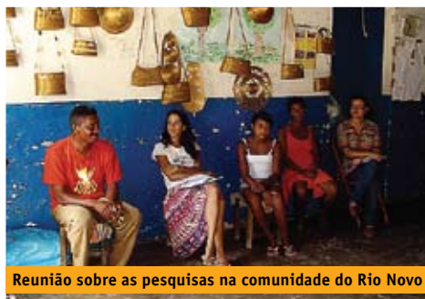
Reunião sobre as pesquisas na comunidade do Rio Novo