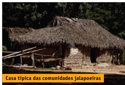
Casa típica das comunidades jalapoeiras