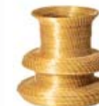
vaso zig zag largo 25 22 cm de altura 18 cm base