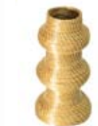
vaso zig zag estreito 27 24 cm de altura 7 cm base