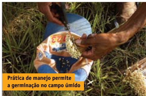
Prática de manejo permite a germinação no campo úmido