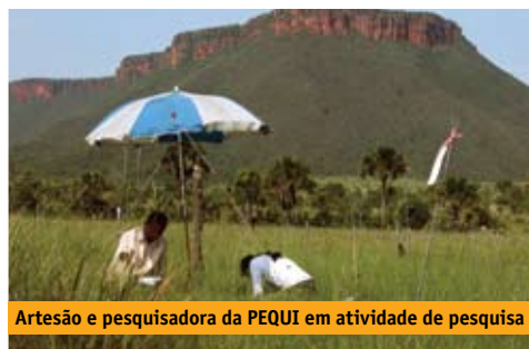
Artesão e pesquisadora da PEQUI em atividade de pesquisa

Comprar artesanato de capim dourado de associações que respeitam as regras socioambientais é uma forma de contribuir para a melhoria da qualidade de vida dos artesãos e também para a conservação do Cerrado do Jalapão!