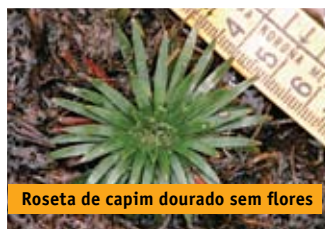
Roseta de capim dourado sem flores