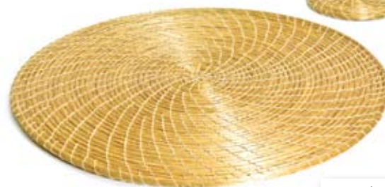
suplá 35 cm de diâmetro