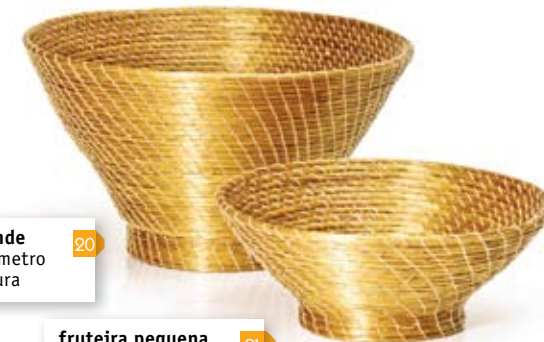
fruteira grande 20 25 cm de diâmetro 15 cm de altura