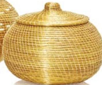
pote redondo médio 18 cm de diâmetro