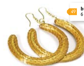
49 brinco meia-lua 6 cm