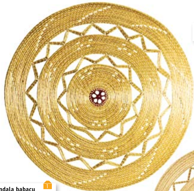
mandala babaçu 54 cm de diâmetro