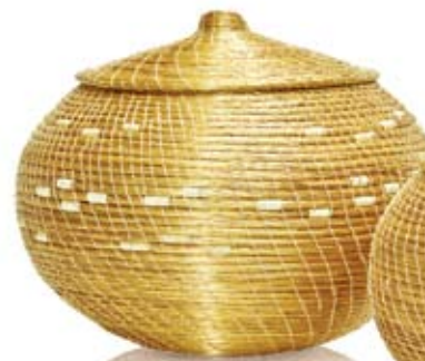
pote redondo grande 20 cm de diâmetro

Esses grupos estão situados nos municípios de Ponte Alta do Tocantins, Mateiros e São Felix do Tocantins.