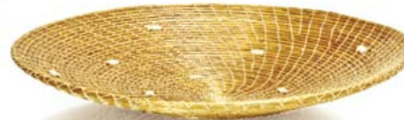
prato com detalhes buriti 34 cm de diâmetro