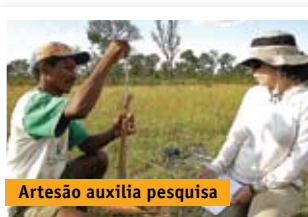
Artesão auxilia pesquisa

Comprar artesanato de capim dourado de associações que respeitam as regras socioambientais é uma forma de contribuir para a melhoria da qualidade de vida dos artesãos e também para a conservação do Cerrado do Jalapão!