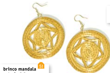
brinco mandala estrela 5,5 cm