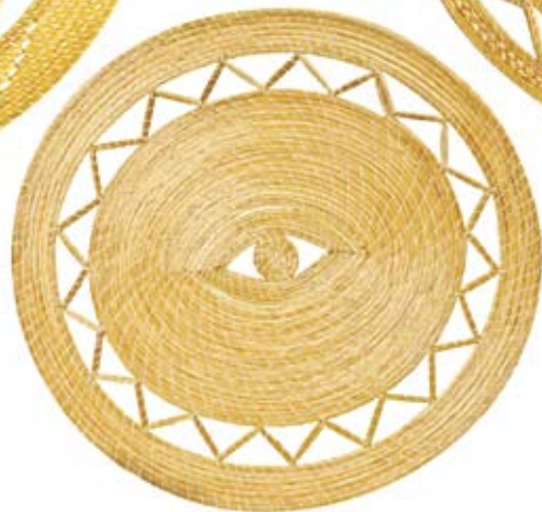
mandala olho 34 cm de diâmetro criação do Prata