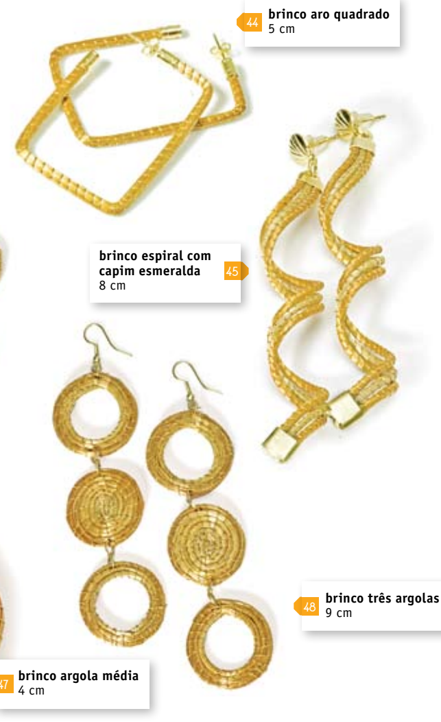
brinco espiral com capim esmeralda 8 cm