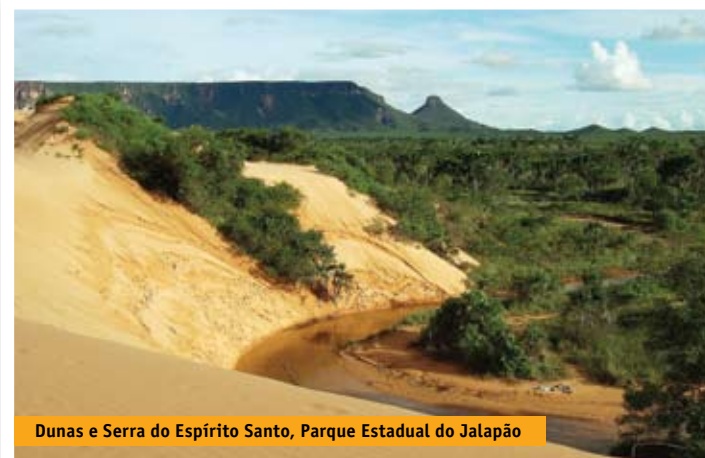
Dunas e Serra do Espírito Santo, Parque Estadual do Jalapão