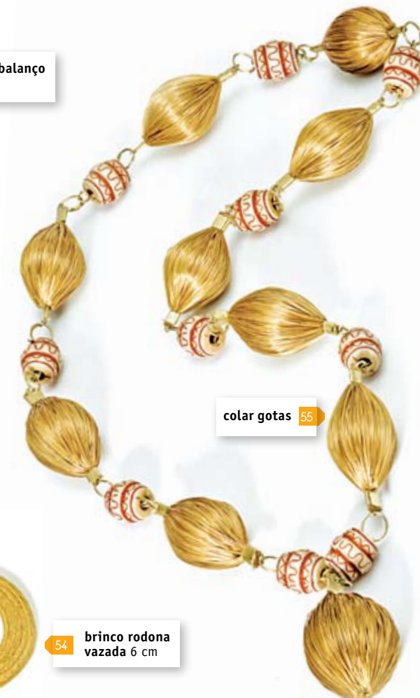
colar gotas 55