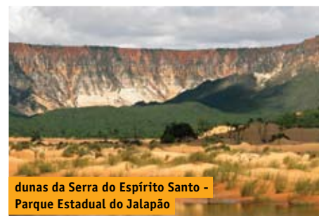
dunas da Serra do Espírito Santo - Parque Estadual do Jalapão