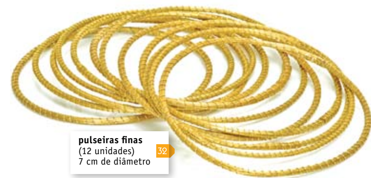
pulseiras finas (12 unidades) 7 cm de diâmetro