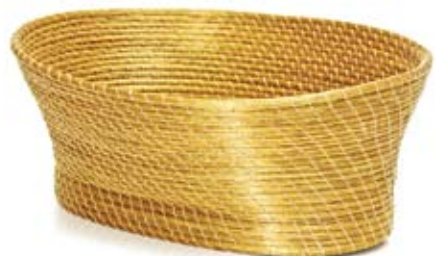
fruteira oval 30 cm de diâmetro 12 cm de altura