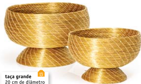
taça grande 13 20 cm de diâmetro 12 cm de altura