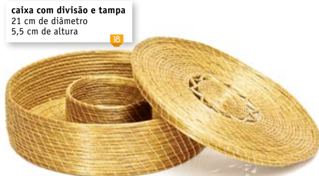
caixa com divisão e tampa 18 21 cm de diâmetro 5,5 cm de altura