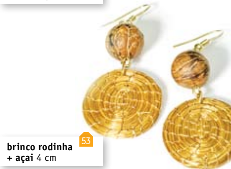
brinco rodinha + açaí 4 cm