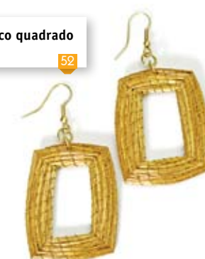
brinco quadrado 4 cm