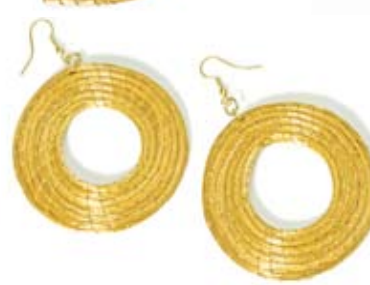
54 brinco rodona vazada 6 cm