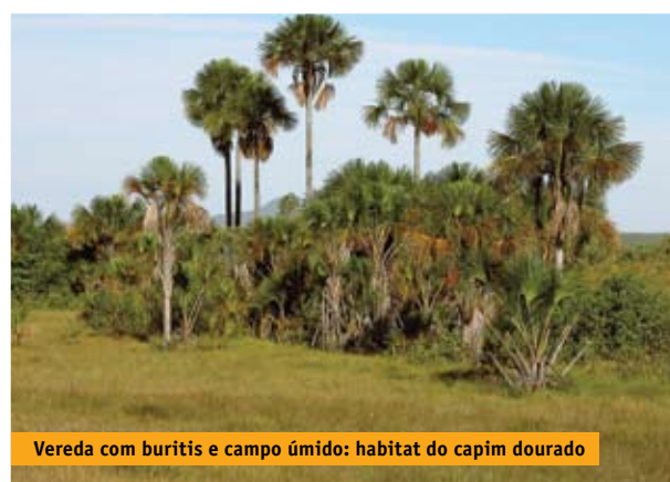
Vereda com buritis e campo úmido: habitat do capim dourado