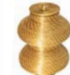
vaso zig zag com tampa 26 25 cm de altura 12 cm base