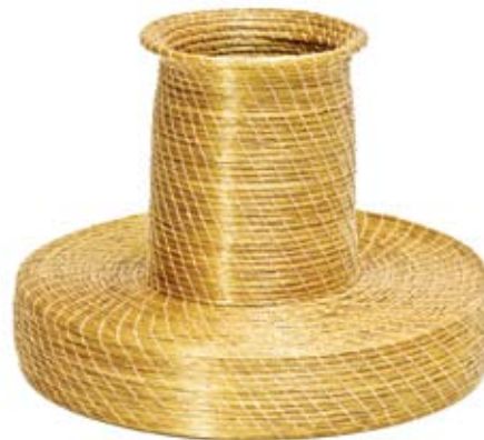
jarro tamanduá 24 cm de altura x 30 cm base Criação Mateiros