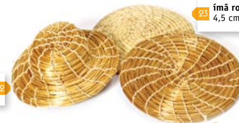
ímã chapéu 22 4,5 cm x 5 cm