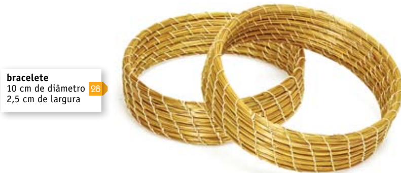
bracelete 10 cm de diâmetro 2,5 cm de largura